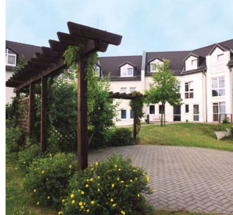
Hansering: Modern und gemütlich.

Weitere Informationen dazu erhalten Sie auf unserer Homepage.